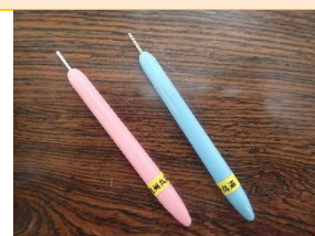
クイリングスロット